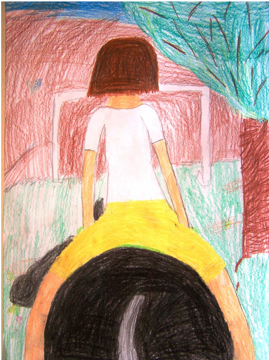
Dunaszentgyörgyi Régiós Találkozó - Mózses Csenge rajza

A NOE Al-Duna Régióközpontja, 7622 Pécs, Nagy Lajos király út 9. Tel:72/520-568 2011-08-26. 5.évfolyam 17. szám noepecs@pphf.hu www.noepecs.hu